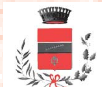
Comune di Corchiano