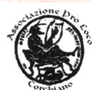
Pro Loco Corchiano